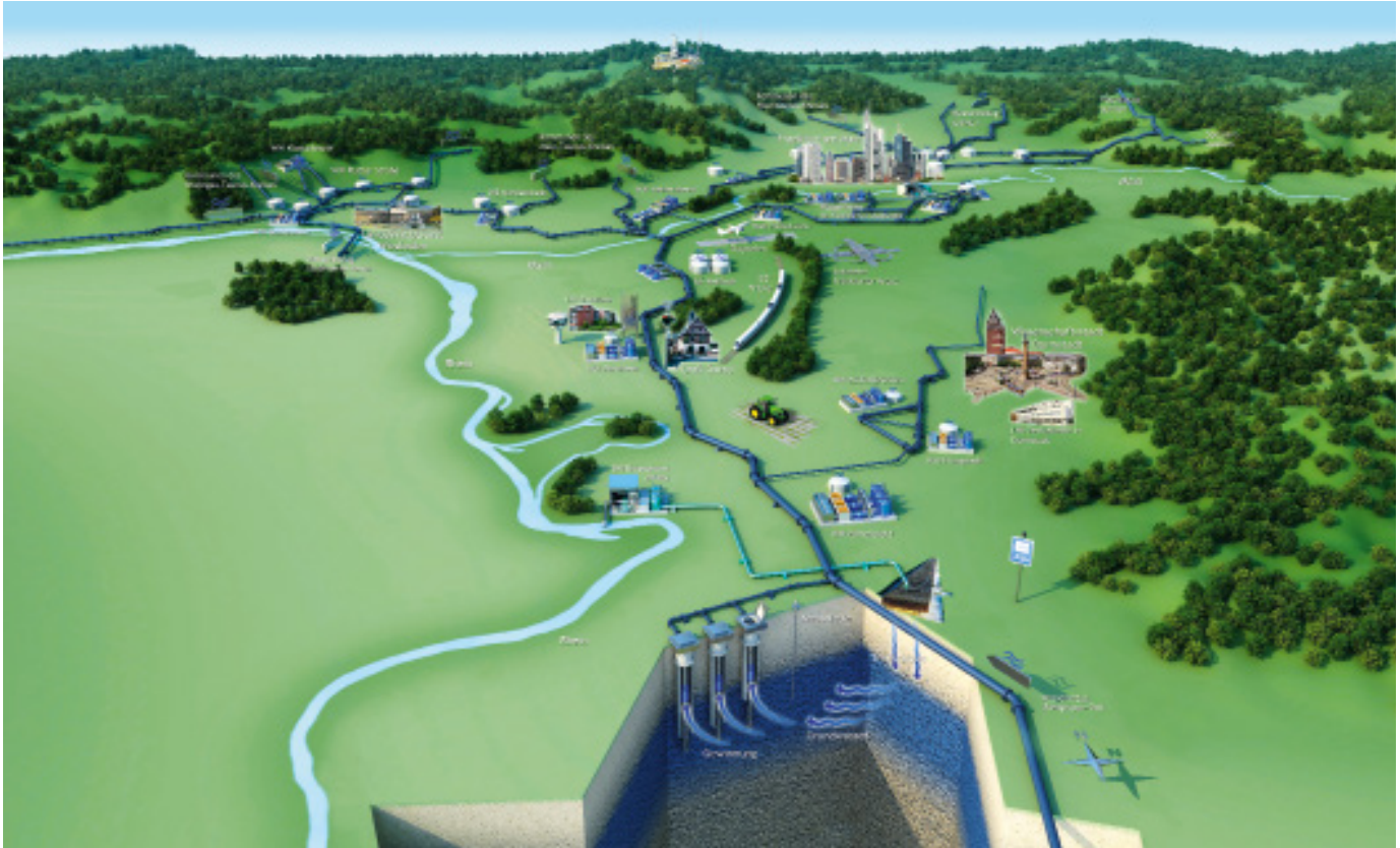
Schema der Grundwasserbewirtschaftung im Hessischen Ried und des regionalen Trinkwasserleitungsverbunds