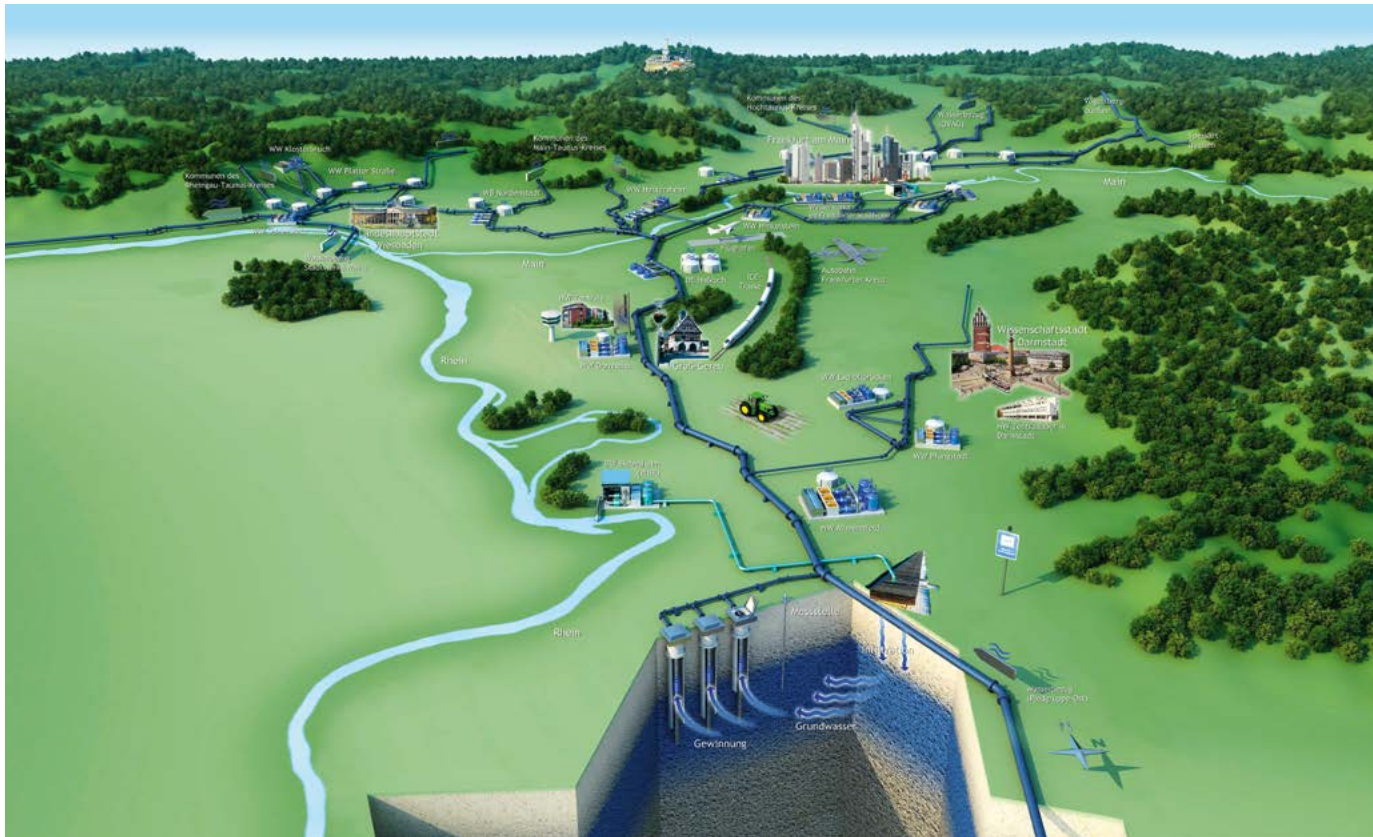
Schema der Grundwasserbewirtschaftung im Hessischen Ried und des regionalen Trinkwasserleitungsverbands